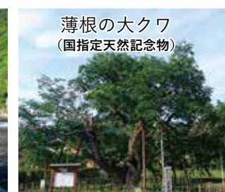
薄根の大クワ(国指定天然記念物)