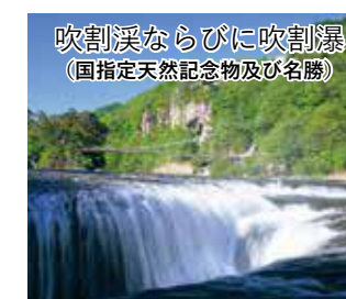
吹割溪ならびに吹割瀑(国指定天然記念物及び名勝)