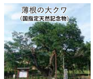
薄根の大クワ (国指定天然記念物)