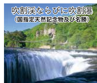
吹割溪ならびに吹割瀑 (国指定天然記念物及び名勝)