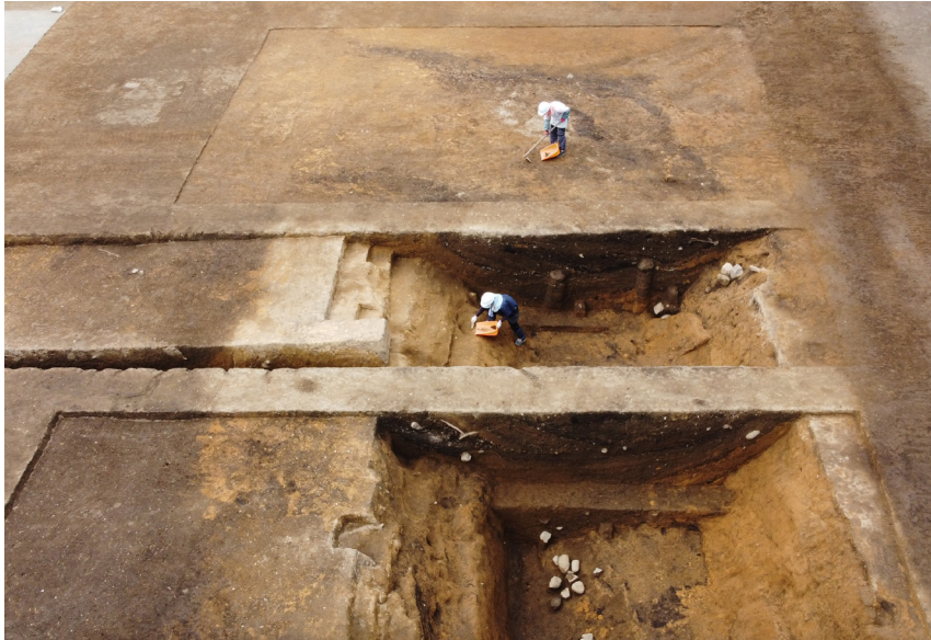
うまだし 古い堀跡 (馬出の一部) 西から Previously unknown moat remains