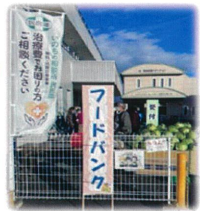
写真：県内医療生協で開催の時の様子