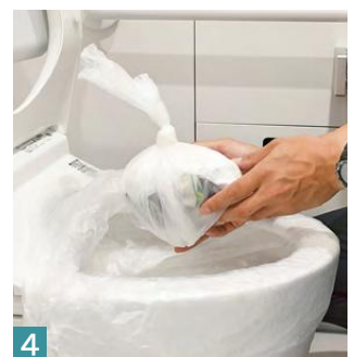
4 排泄後、上の袋だけを外して口を結んで捨てる