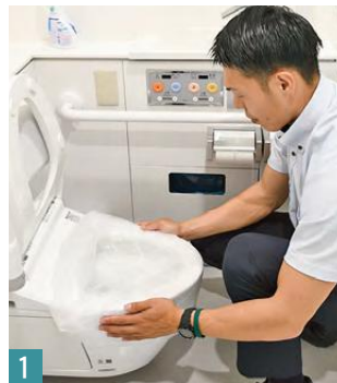
1 便座を上げ、ゴミ袋を二重にして便器にかぶせる

停電や断水などで長期間トイレが使えなくなることもあり、安心してトイレに行ける環境を整えることが大切です。ペットシートは水こぼしを拭く布代わりや、冷却シートや湯たんぽのようにも使えます