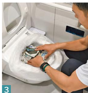
3 丸めた新聞紙を載せる。消臭効果や排泄物の目隠しに