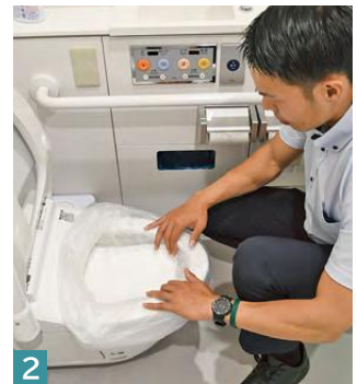
2 給水面を外側にしてペットシートを二つ折りにし、中央に置く