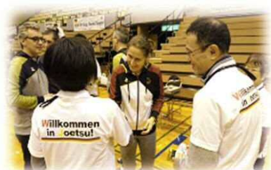
▲ドイツトランポリンチーム合宿サポート隊

上越市では、オリンピックやドイツに関心を持っていただくため、2019年10月から「上越市ホストタウンサポーター」の募集を開始しました。2021年6月30日現在、126名・1団体が登録されています。市では月1回程度、「ホストタウンサポーター通信」を発行し、ホストタウンの取組、オリンピック・パラリンピックやドイツに関する情報を提供しているほか、サポーターの皆さんには「サポーターズアクション」として、ドイツチームの合宿サポートや交流活動に参加してもらっています。