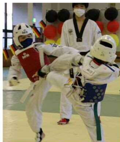
輝暉会の参加生による組手