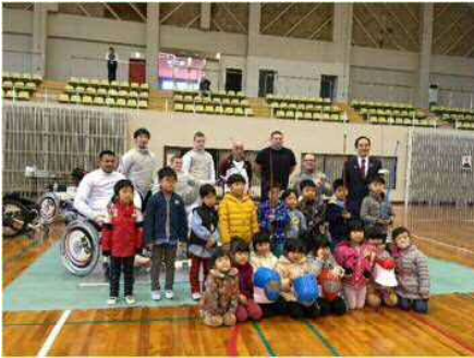
▲宝保育園園児との交流