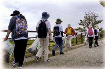
▲聖火リレールートクリーン隊