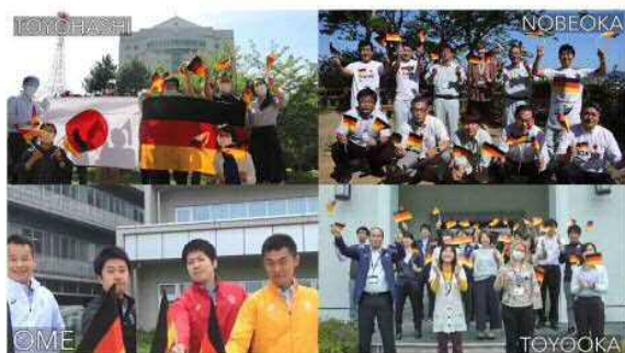
延岡市・青梅市・豊岡市と共同作成の コロナに負けるな応援動画