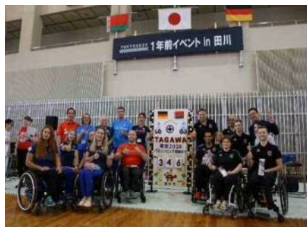
▲1年前イベント in 田川