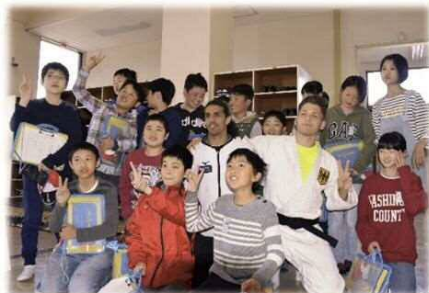
▲ドイツパラ柔道チームと市内小学生との交流