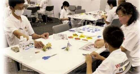
▲ドイツ体操チームを手作りのお土産でおもてなし隊