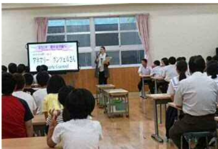
▲学校でドイツについて紹介