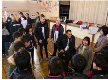
▲児童生徒からの質問に答える様子