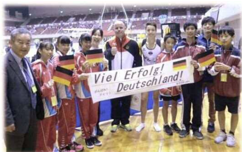
▲2017国際ジュニア体操競技大会への応援団派遣

また、ドイツパラリンピック柔道チームの合宿を2018年8月、2019年4月、2020年2～3月と3回受け入れ、地元選手との合同練習、学校訪問、日本文化体験等、幅広い交流を実施してきました。