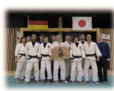
▲ドイツパラ柔道チームの合宿（県立武道館）