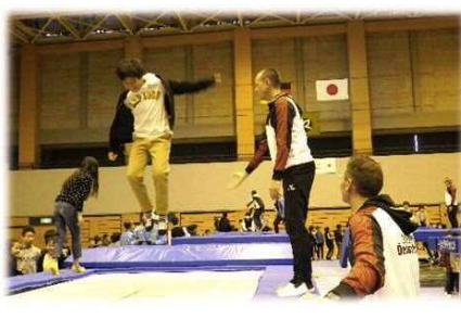
▲ドイツトランポリンチームと市内小学生との交流