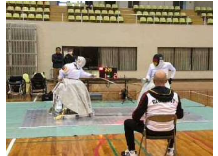
▲公開トレーニングの様子