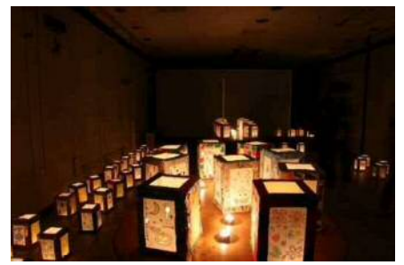
▲小学生が作成したランタン （サントマーティンで展示）