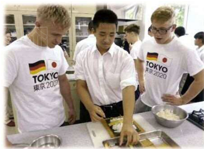
▲ドイツパラ柔道チーム（U21選手含む）と市内高校生との交流