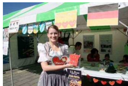
▲コールマインフェスティバルで ドイツ文化コーナーを開催