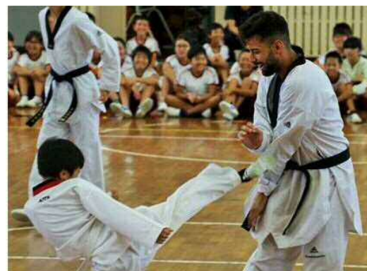
本市小学生とのテコンドー交流 オリンピックの技の披露、技体験や組手等 数々の交流を実施しました