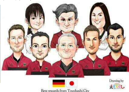
Best regards from Toyohashi City