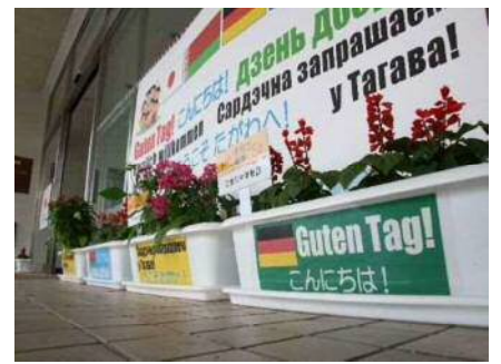
▲市内小中学校が花植え