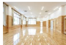
← 卓球場(1階) ※多目的利用