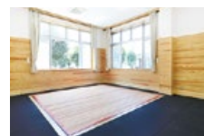
ウエイトリフティング場(1階) →

問合せ 沼田市体育協会(ZACROSアリーナぬまた内) ☎24-9444、スポーツ振興課スポーツ振興係 ☎内線 3 3 3 3