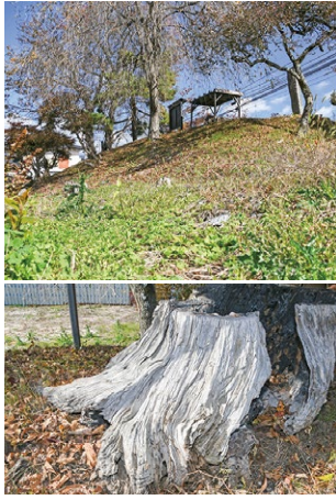
上) 住宅街にある正縁塚を見上げる 下) 直径約1mの松の木の根っこが残る