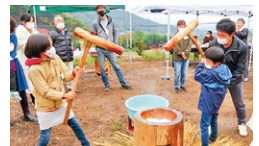
収穫祭での餅つき。腰を入れてつけたかな