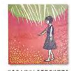
沼田女子高等学校同窓会