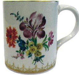
マイセンビアマグ

マイセン 1709年にドイツで ヨーロッパ最初の磁 器を完成させました。 マイセンのドイツの 花は、花束模様のルー ツと言われています。