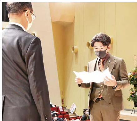
成人式で募った新型コロナウイルス感染症対策支援募金の目録を読み上げる