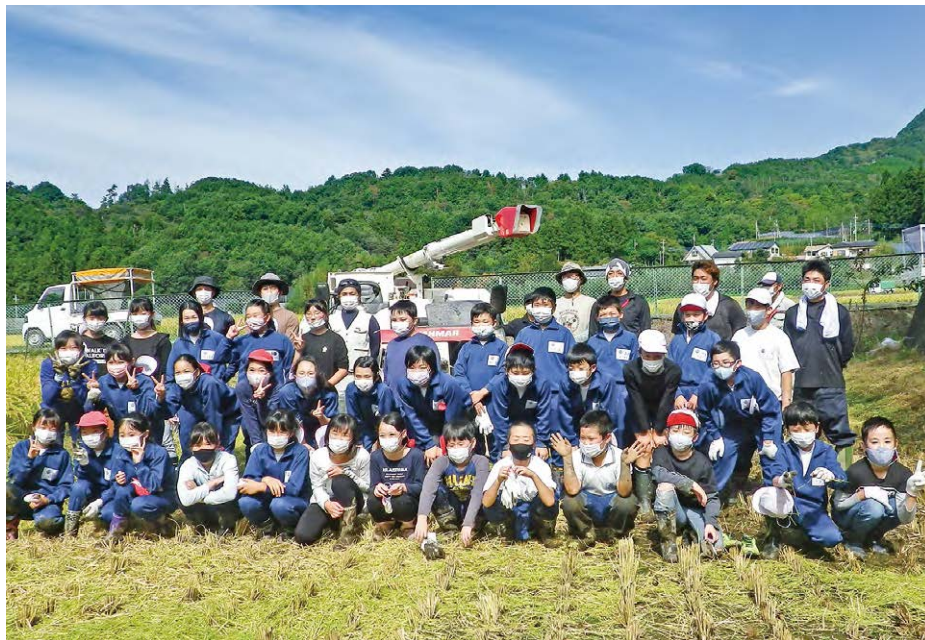
収穫に喜びを感じ、コンバインの前で記念撮影する児童とJA職員ら