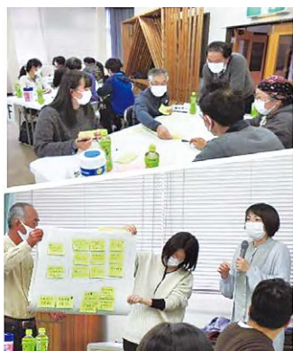
▲川田シンポジウム

30代から70代まで約30人の川田地区住民が集まり「明日の川田を考えるシンポジウム」と銘打った座談会を開催しています。同じ地区に住んではいるものの、決してご近所ではなく、世代も性別も違う皆さんが集い、初めは少しのよそよそしさを感じながらも、それぞれが持つ「川田への思い」ですぐに打ち解け、今は活発な意見交換ができ、これからの地域について考える場となっています。