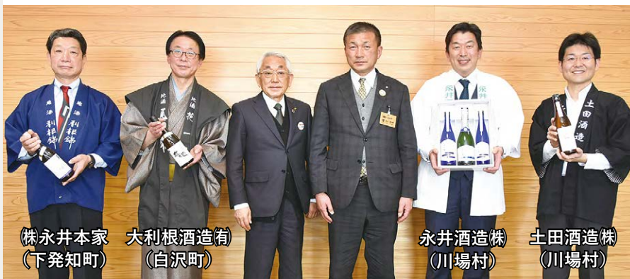
株永井本家 (下発知町) 大利根酒造(白沢町) 永井酒造株 (川場村) 土田酒造株 (川場村)