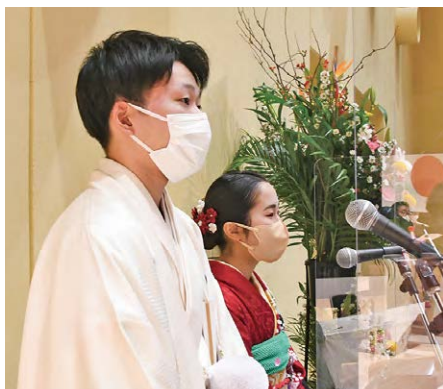
緊張しながらも、スムーズな式典の司会進行を務めた新成人