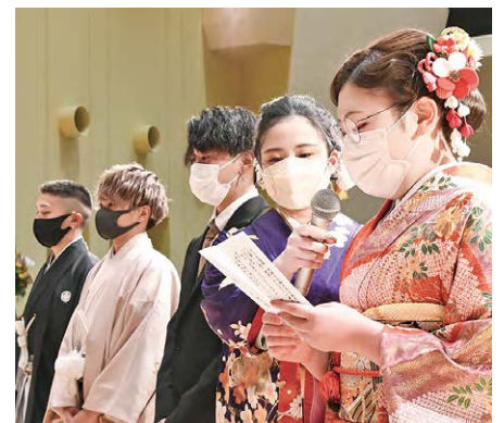
成人への期待を胸に抱負を新たに、両親らへの感謝を述べる新成人代表