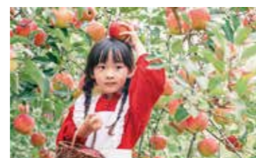
昨年度の最優秀賞