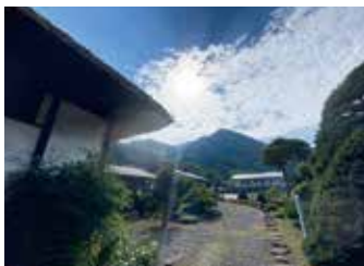
南郷の曲屋から見た景色

地域おこし協力隊として移住してから 8 カ月が経ちました。暑い日差しの下、南郷の曲屋で心地よく