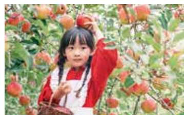
昨年度の最優秀賞