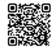
市HPの二次元コード