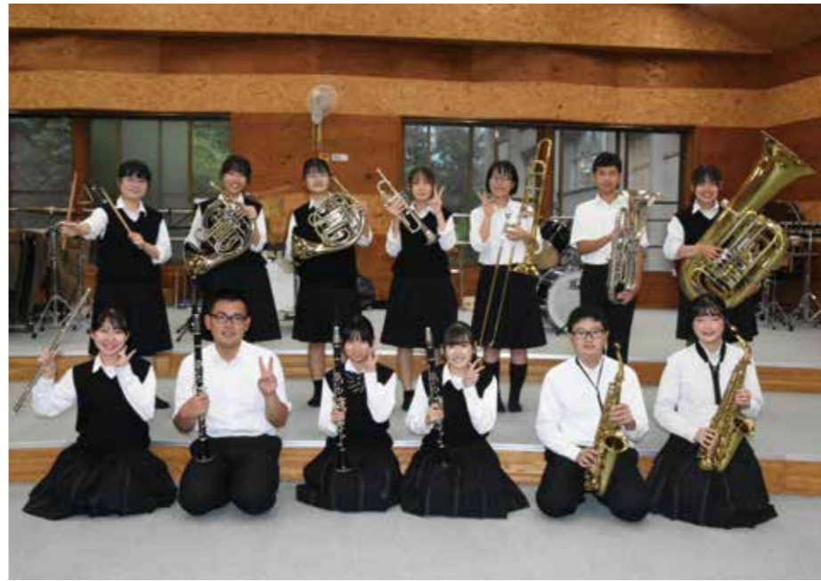
利根商業高校吹奏楽部