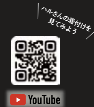
ハルさんの着付けを見てみよう

現在は裏方で役者を見守ることが多いという生方さん。「客席からの拍手がうれしい。最高齢ですが、若い子たちと打ち上げに参加するのが楽しい」と顔をほころばせます。