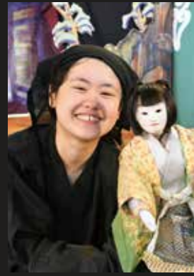
18番は意地悪な船頭 役にはまった所作を披露