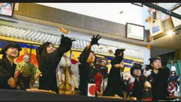
三番叟の公演終了後、客席へ向かってお菓子を投げ、観客の幸福を祈願するのが座の定番となっている

来春、高校を卒業して県外へ進学する予定です。帰省時には稽古場へ顔を出したり団員と連絡を取り合ったりしながら、これからも人形芝居に関わっていきます。