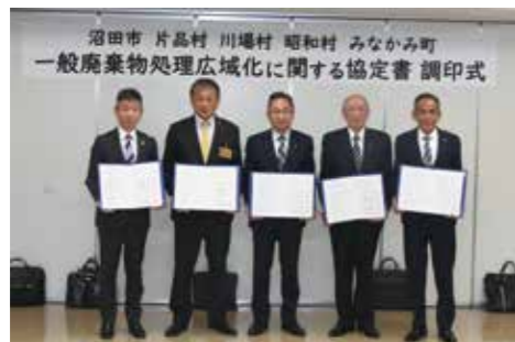
左から片品村、川場村、沼田市、昭和村、みなかみ町の首長