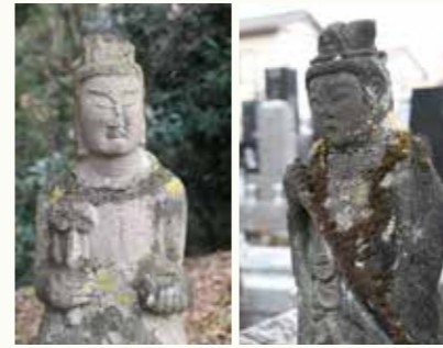
善桂寺八幡宮(左)と源寺(右)の文殊菩薩の像

干支という癸卯、兔年を迎えた。優しく降り注ぐ雨、大地に恵みをもたらす水を表す「癸」。穏やかだが小さな体でピョンピョン跳ねる「卯」。今年には平穏や飛躍、発展が約束され、新しいことに挑戦するのに最適な新年である。 うさぎ年の人の守り本尊は文殊菩薩で、この仏は知恵を司ることで知られ、ことわざの「三人寄れば文殊の知恵」はよく使われる。学業の向上、合格祈願の御利益など、うさぎ年にちなみ今年には文殊菩薩の知恵の効能が見込まれる。