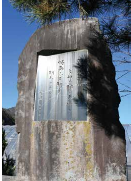
若山牧水 - わかやまほくすい -

本名・若山繁。宮崎県に生まれ、早稲田大学文学部英文科に進んだ。1910（明治43）年発刊の第3歌集「別離」で歌人としての地位を築く。短歌の他に随筆、童話、紀行文などを数多く手掛け、9,000首（未発表含む）もの歌を残している。1918（大正7）年と1922（大正11）年の2回、利根沼田を訪れた。