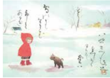
短歌:「いぬさへも息しろくはきて野は寒し雪の日も生きむ希みあるべく」生方たつ糸 / 絵:「帰り道」中野はる