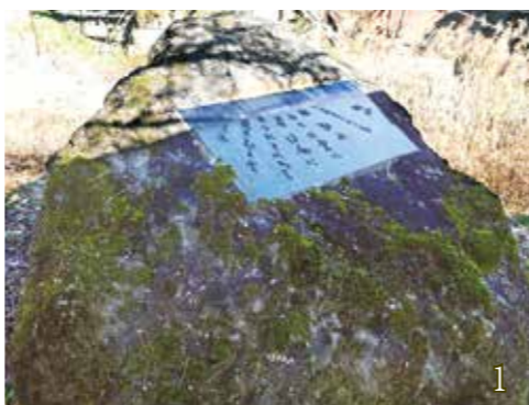
〈1・2〉1985（昭和60）年の生誕100年を記念して老神に建てられた牧水碑（P6写真上も同様）と近辺の牧水橋 〈3〉牧水パネルが利根小学校へ巡回