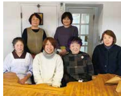
南郷の曲屋のお母さんたちと

沼田市へ移住して1年を迎えます。着任した1月は、雪かきから始まり、ホイールローダーでの除雪、かまくらに竹灯籠と、雪国を全身で楽しみました。春には曲屋でそば打ちの体験などが再開し、お客様と一緒にイベントを楽しみ、夏は元気な草たちを草刈り機で刈りまくり、秋は毎日が紅葉狩りと、感動の1年間でした。協力隊でなければ、どれも経験できなかったと思います。 沼田をどんどん好きになってきたところでしたが、12月をもちまして東京に帰ることになりました。沼田を離れるのはとても寂しく、任期中、うでぎずに悔しいですが、東京でも沼田の魅力を伝えて、いつまでも沼田と関わってあげたいと思います。本当にありがとうございました。