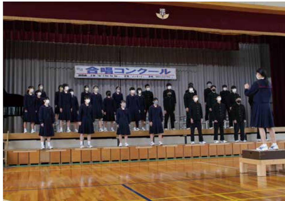
「響進花(きょうしんか) ~心歌 芯歌 深歌 進歌」をスローガンに開催