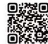
申し込みフォーム二次元コード