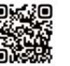
特設WEBサイト二次元コード

マイナンバーカードを持っている、または申請済みの群馬県民を対象に、抽選で1万人に県特産品が当たるプレゼントの応募を受け付けています。この機会にマイナンバーカードを申請してご応募ください。