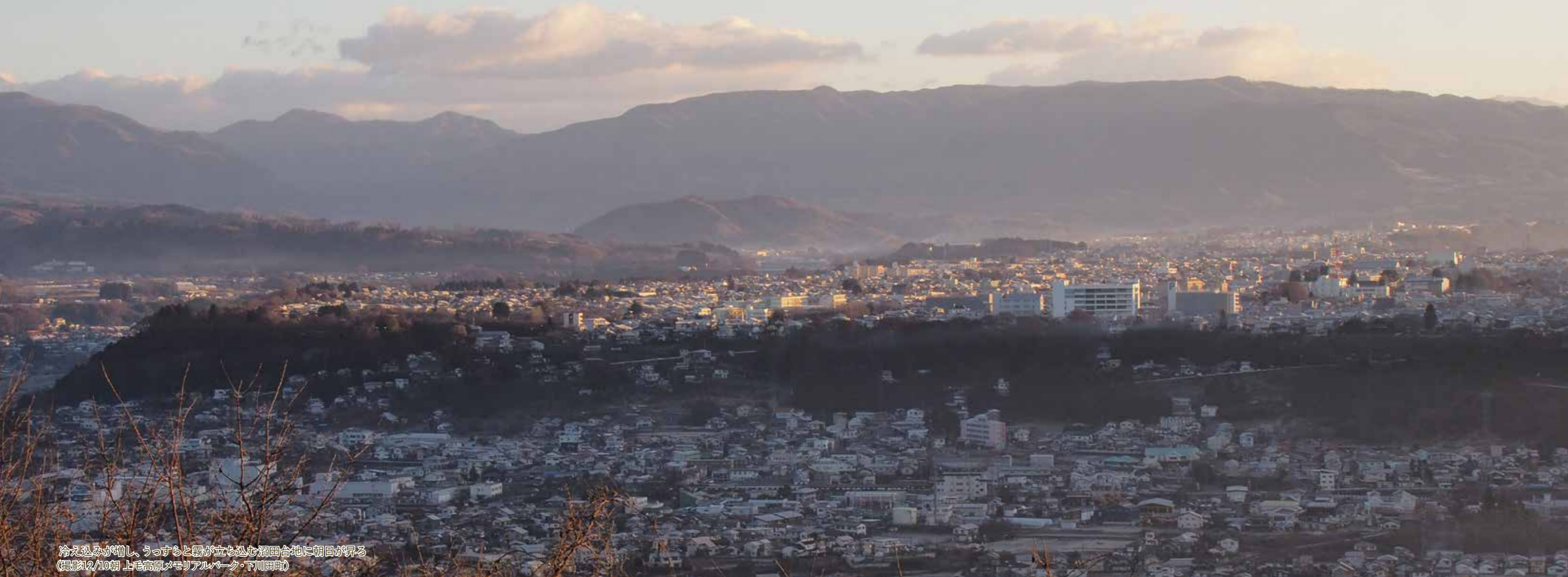
冷え込みが増し、うっすらと霧が立ち込む沼田台地に朝日が昇る (撮影12/10朝 上毛高原メモリアルパーク・下川町)