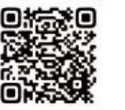
提案書、応募フォームはこちらから