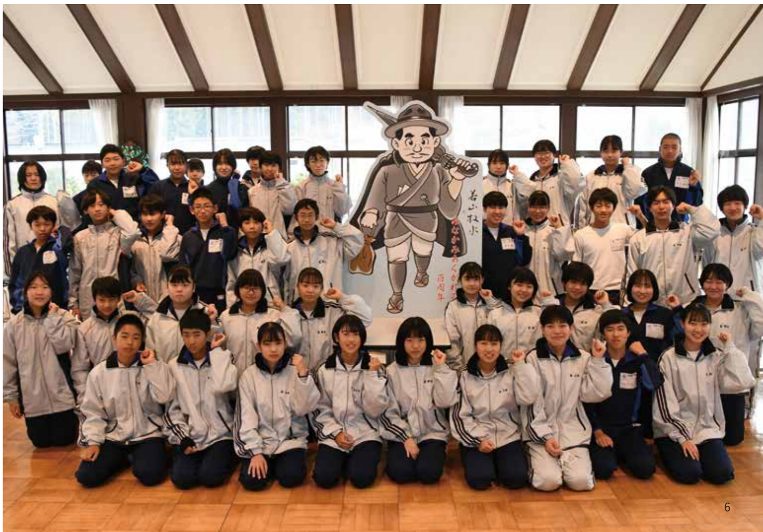
利根沼田の施設や学校を巡回する牧水パネル。利根中学校ではパネルを囲み、傘を背負うポーズで記念撮影

旅とともにお酒や自然をこよなく愛した歌人、若山牧水は、全国を旅し、詩情豊かな多くの歌を残しました。名随筆「みなかみ紀行」の旅から100年。片品溪谷や老神温泉で詠んだ歌とともに、牧水の旅路をたどります。