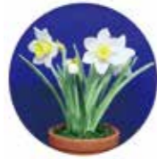
樹脂粘土で作るミニ水仙