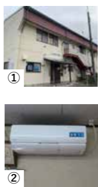
①西原新町会館 屋根改修 ②上川田町住民センターエアコン設置 ③善桂寺町活性化センターエアコン設置

沼田市公共施設の空き状況確認サービスを開始します。2月1日(水)午前8時30分以降に、インターネットサイト (https://numata-city.ren.jp/) または次の二次元コードへアクセスし、空き状況の確認ができます。まずはテラス沼田6階のコミュニティテラスと、各地区コミュニティセンターの公開ですが、準備が整った施設から順次掲載する予定です。