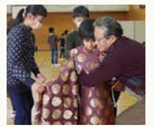
この衣装 似合うかな??