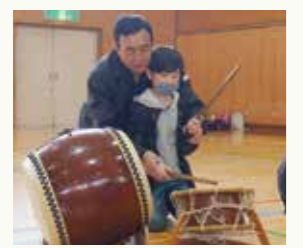
アクセントや強弱 多彩な表現を奏でよう