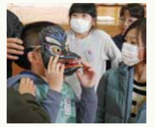
色鮮やかなお面に 興味津々