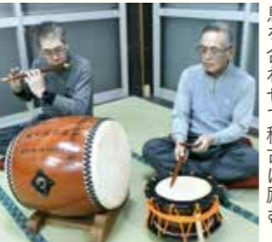
息を合わせて稽古に励む

薄根太々神楽保存会と薄根太々神楽硯田保存会は、それぞれ約15人が所属し、平均年齢は60歳前後。元は1つの団体でしたが、奉納する神社や練習拠点が異なることから、現在は別々に活動しています。お互いの良さを生かした伝承に努め、平成5年の式年遷宮時には、合同で伊勢神宮へ奉納しました。 両会とも、稽古は公演1カ月前の夜間に行っています。踊りや演奏は技を見て覚えたり、直接教わったりしながら受け継がれてきました。それぞれの役に独特な動きがあり、一度途絶えると正しく伝えられなくなるといいます。 地元の子どもの交流にも力を入れ、コロナ前までの毎年2月には、薄根小学校3年生を対象に体験学習会を行ってきました。児童は神楽の歴史や物語を聞いてから、鈴の