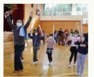
足を運んで腕を振って 優雅に舞おう