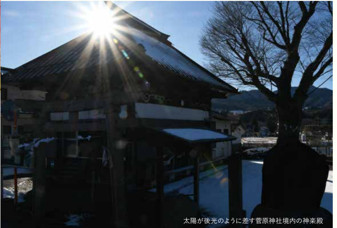
太陽が後光のように差す菅原神社境内の神楽殿

薄根太々神楽保存会と薄根太々神楽硯田保存会は、それぞれ約15人が所属し、平均年齢は60歳前後。元は1つの団体でしたが、奉納する神社や練習拠点が異なることから、現在は別々に活動しています。お互いの良さを生かした伝承に努め、平成5年の式年遷宮時には、合同で伊勢神宮へ奉納しました。 両会とも、稽古は公演1カ月前の夜間に行っています。踊りや演奏は技を見て覚えたり、直接教わったりしながら受け継がれてきました。それぞれの役に独特な動きがあり、一度途絶えると正しく伝えられなくなるといいます。 地元の子どもの交流にも力を入れ、コロナ前までの毎年2月には、薄根小学校3年生を対象に体験学習会を行ってきました。児童は神楽の歴史や物語を聞いてから、鈴の