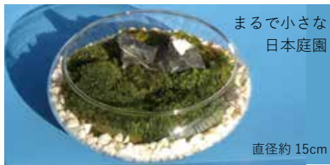
まるで小さな日本庭園 直径約15cm