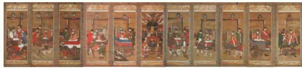
地藏菩薩を中幅に、十王図を左右五幅に描いた絹本着色地藏十王図

家康は重臣本多忠勝の娘・稲姫を養女に迎えた。稲姫は天正17年(1589)真田信幸に嫁したことを縁に、沼田に入り「小松殿」と呼ばれ、良妻賢母として沼田で花開き、城下町の母になった。元和6年(1620)、江戸で病んだ小松殿は療養に草津へ向かう途中、埼玉県鴻巣で48歳で没した。墓所は沼田の正覚寺、鴻巣の勝願寺、上田の芳泉寺に分骨され葬られた。正覚寺には重厚な宝篋印塔の「大連院殿」の墓が御霊屋の横に建つ。小松姫愛用の「徳川葵家紋文箱」や寄進した「絹本着色地藏十王図」など由縁の宝物も寺に残されている。