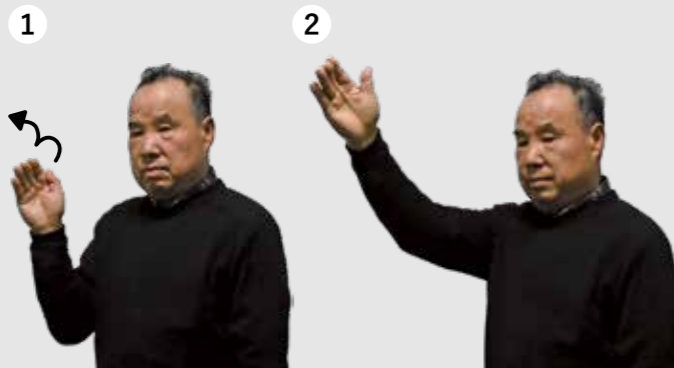
片手を2回、斜め上に出す