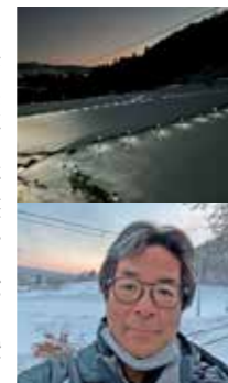
大雪後の石墨棚田

県主催の研修では、他市町村の隊員と交流し刺激を受け、インバウンドセミナーでは、語学よりおもてなしの大切さを痛感しました。大好きなスノーボードは、ひと月足らずで過去5年分の滑走数を超えたと思います。3月以降も楽しみながら頑張ります。