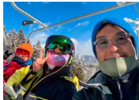
東京から来た娘、息子と滑ることができました

県主催の研修では、他市町村の隊員と交流し刺激を受け、インバウンドセミナーでは、語学よりおもてなしの大切さを痛感しました。大好きなスノーボードは、ひと月足らずで過去5年分の滑走数を超えたと思います。3月以降も楽しみながら頑張ります。