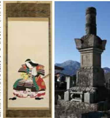
写真右) 正覚寺の小松姫の墓は市重要指定文化財 左) 小松姫の冥福を祈るために建立された大英寺(長野市)が所蔵する大連院画像

沼田を代表する歴史の女性といえ小松姫であろう。城下町沼田の基盤を夫の真田信之と共に造り、慶長5年(1600)の関ヶ原の役では留守の城を気丈に守った。その後、義父・昌幸と義弟・信繁の命乞いを家康に願い、配流地への援助を続けるなど一門を思いやり、家門繁栄と領民の安穩に腐心した。女丈夫ながら細やかで優しさを兼ね添えた人柄は心を揺さぶり、微笑ましい。多くの人が今も慕い墓参する由縁である。