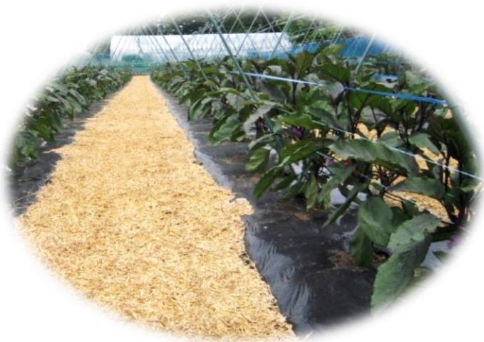
乾燥防止のための 通路への敷きわら