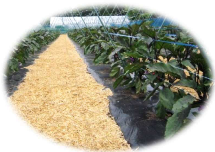
乾燥防止のための 通路への敷きわら