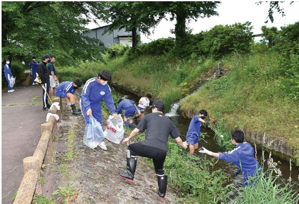
トングなどを使って、川の中のごみ拾いを行う生徒たち