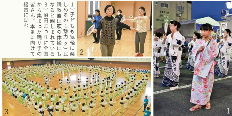
1) 子どもも気軽に楽しめるのも魅力。民踊教室は頭の体操にもなる。2) 沼田まつりに全国各地から集まった踊り手の皆さん。本番に向けて稽古に励む

動きそろえて しなやかに 民踊「沼田音頭」「沼田天狗ばやし」に乗せて踊る千人おどり。沼田城とききょうの絵柄の浴衣を着た踊り手が列を組み、しなやかに踊り歩きます。昭和30年代、婦人会などが輪踊りとして踊っていたのが始まり。自然や地域の特色を伝承するために、歌詞や動きで表現しています。千人の名のとおりに、人数が多いほど迫力があり盛り上がりがあります。昭和48年頃から沼田まつりに参加。例年、初日3日の夜7時頃、待ちに待った踊り手たちが披露します。服装は自由で、どなたでも参加できます。平成29年には、全国の日本フォークダンス連盟会員500人が、沼田まつりに集い踊りを楽しみました。