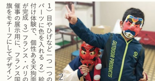
1) 目やひげなど一つ一つのパーツに色を入れる。2) 絵付け体験で、個性ある天狗面が完成。3) フランス・パリの催事の展示用に、フランス国旗をモチーフにしてデザイン