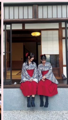
応募作品のイメージ