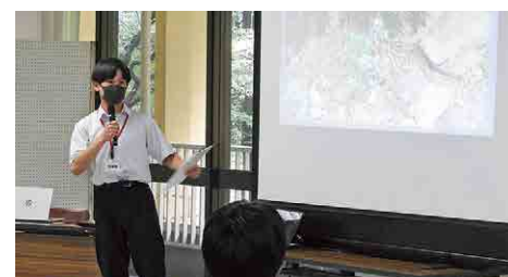
◎新宿にて環境をテーマに発表会を行う尾瀬高校生