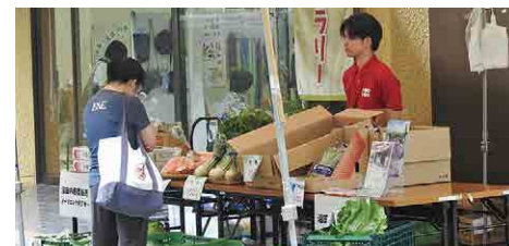
◎沼田市の野菜や特産品の販売を通してPR