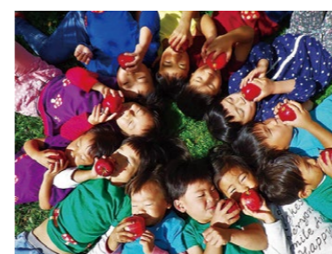
昨年度の最優秀賞