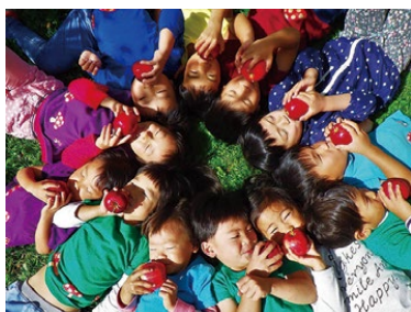
昨年度の最優秀賞