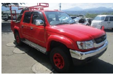
トヨタ ハイラックス

出品車両 トヨタハイラックスS1台、三菱ローザ1台 申込期限 9月19日(火)までに、市HPまたはKSI官公庁オークションページ 問合せ 財政課FM推進係 ☎ 内線4045