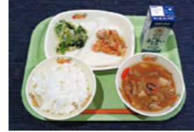
写真はイメージ。当日のメニューとは異なります

学校給食を身近に感じ理解と知識を深めてもらえるよう、試食会を行います。10月の給食目標「地域の食材を知ろう」をテーマに、利根町に古くから伝わる郷土料理「豆腐めし」や多くの地場産食材を取り入れた内容で提供する予定です。