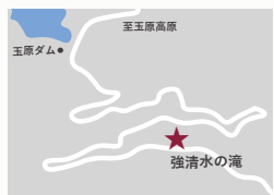
近づくだけでひんやりとした空気を感じられる。滝は発知川につながる。