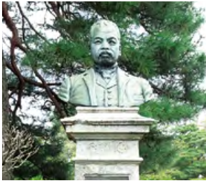
沼田公園の久米民之助像

歴史資料館第22回企画展「久米民之助の軌跡」の関連行事で、沼田公園や近隣の寺院を徒歩で巡る見学ツアーを行います。