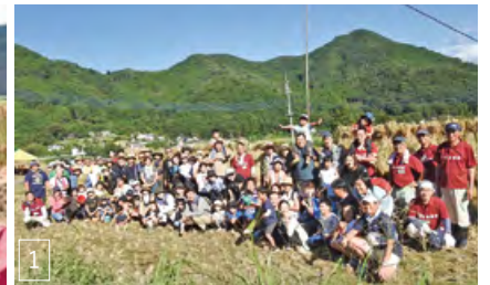
(1) 棚田オーナーの皆さんと稲刈り後に記念撮影 (2) 「はつてがけ」された稲穂 (3) 稲刈り作業中の棚田