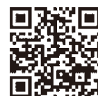
認証キーの取得方法 発注者への提出方法