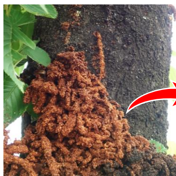
大量に排出されたフラス