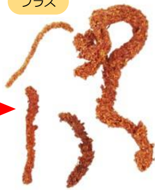
形はかりんとう状