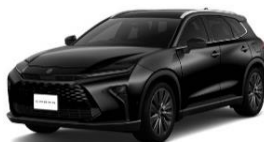
クラウン(エステート)