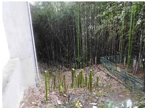
雨の中の作業は大変でした！