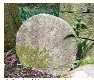
芭蕉の句が刻まれた石碑。この下に亀石があるとも伝えられる。

天狗伝説で知られる「迦葉山弥勒寺」。深山幽谷の霊山には、信仰や観光の参拝者が四季を通じて大勢訪れる。千年以上法灯を継ぐ聖域は、老杉などに守られ清閑が漂う。 静寂な参道の十一丁、山門の先「補陀坂」に、聖徳太子と揮毫される石碑、数個の石が亀のように組まれた亀石がある。この石は明治14年に出版された「迦葉山案内」に次のように紹介される。 「此、石亀の形をなして、道に横たはり、通路に妨げあれば大師曰く、爾亀の形ちヲなし、夫亀八万歳の祝しを保つに、人通の街路を妨げる如何と仰せば、此石忽ち四足を踏で道の傍に出たり、故に亀石と号け後に