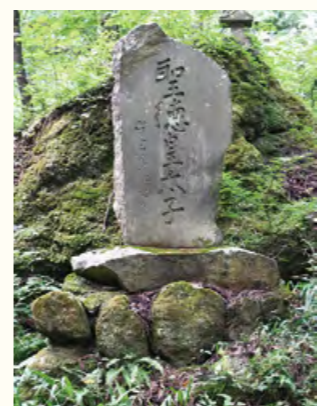
数個の石で組まれた石碑の台座が、亀のように見える「亀石」。