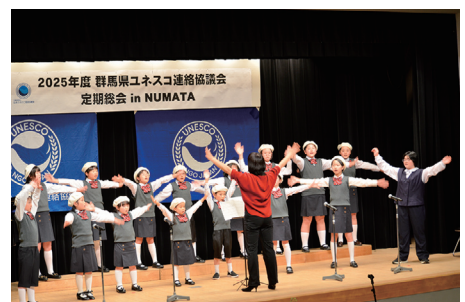
オープニングイベント

議事では昨年度の事業報告・決算報告、今年度の活動方針・事業計画・予算の承認を得た後、来年度の関ブロ群馬大会の事業計画の説明を行いました。議事終了後、関ブロの下見ということで、文化会