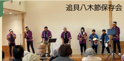
追貝八木節保存会

約6年ぶりの開催となった利根町芸能祭。沼田市文化協会利根支部からは追貝八木節保存会にご出演いただきました。