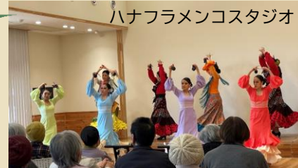
ハナフラメンコスタジオ