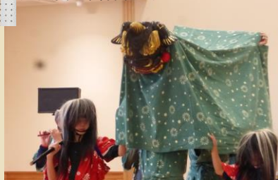
追貝獅子舞保存会