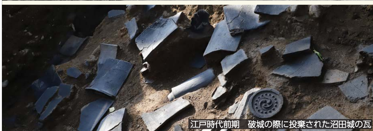
江戸時代前期 破城の際に投棄された沼田城の瓦