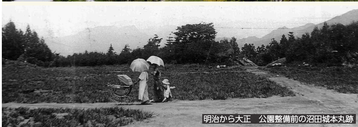
明治から大正 公園整備前の沼田城本丸跡