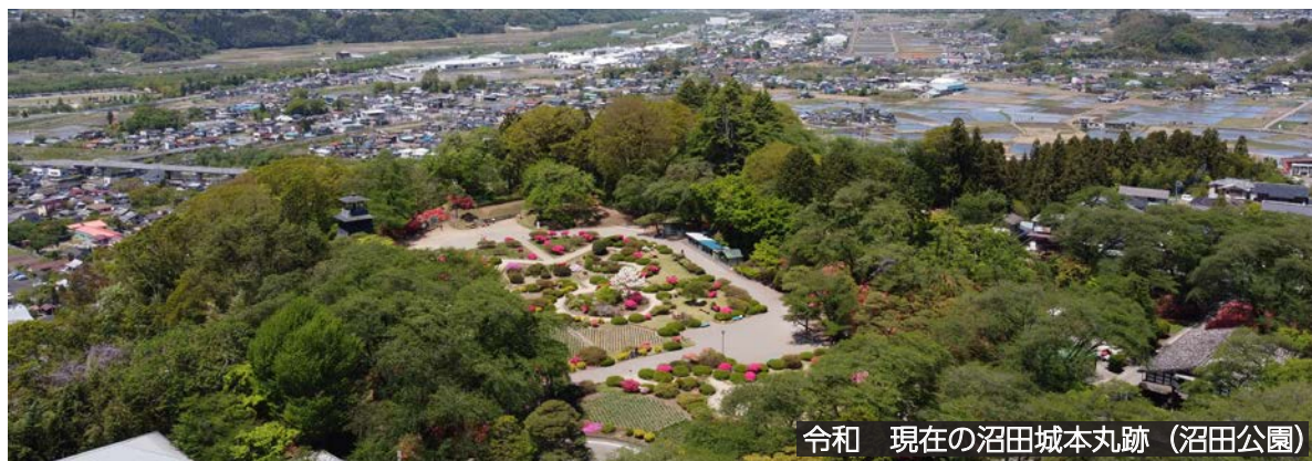
令和 現在の沼田城本丸跡（沼田公園）