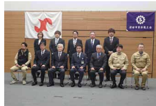
優良従業員・優良技能者表彰式 2/2 テラス沼田

幅18m×高さ3.8mの特設ひな壇や幅6.7m×高さ3mの15段ひな壇などが設置され、県内外から集まったひな人形が飾られました。3月22日まで。