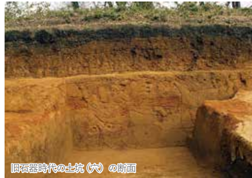
旧石器時代の土坑(穴)の断面

沼田横塚産業団地整備事業に伴う埋蔵文化財発掘調査の成果として、出土資料や発掘調査写真、県内ではめずらしい旧石器時代の土坑の土層断面剥ぎ取り資料を展示します。