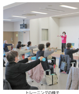
トレーニングの様子

募集 1010611 1年かけて体力・運動習慣を付けていきます。運動初心者大歓迎。体力・筋力が落ちてきたと感じる人も、自分磨きしましょう。 内容 筋トレ(ポジティブトレーニングなど)、口腔体操、レクリエーション、体力測定(年3回)専門職による講話・相談(年6回) とき 4月9日～来年3月18日の木曜日(全41回。8月と年末年始を除く。受付時間 午前9時45分) 4月～7月 午前10時～11時 9月～3月 午前10時～11時30分 ところ 保健福祉センター4回多目的ホール 講師 うすねニーススポーツクラブ指導員など 対象 おおむね65歳以上で運動制限がなく、1年間参加できる市民 定員 45人(抽選。初めての人の優先) 申込期間 3月4日(水)～19日(木) 申込・問合せ 地域包括支援センター ☎(22) 11112