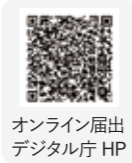
オンライン届出 デジタル庁 HP

対象 電子証明書が有効なマイナンバーカードをお持ちで、日本国内での引っ越しをする人 ※転入時はマイナンバーカードと転出届出時に使用した暗証番号（4桁と6桁以上の2種類）が必要です。詳細は右記QRコードでご確認ください