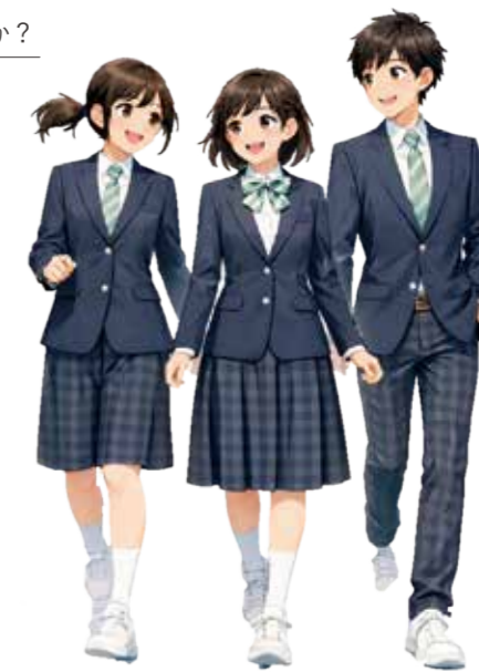
【デザインイメージ】