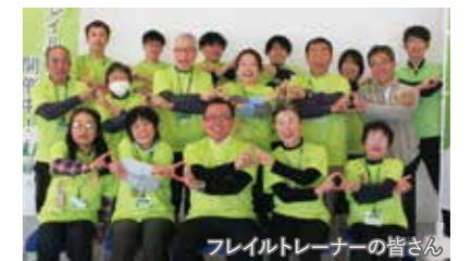
フレイルトレーナーの皆さん

加齢に伴い、筋力や認知機能、社会的つながりなどの心身の活力が低下し、健康と要介護の間の状態になることをフレイルといいます。フレイルサポーター養成講座では、東京大学高齢社会総合研究機構が認定した市のフレイルトレーナーから、フレイルの基礎知識や予防のポイントを学び、修了後、フレイルチェック会などでサポーターとして活動します。フレイルチェック会のみでの参加もできます。