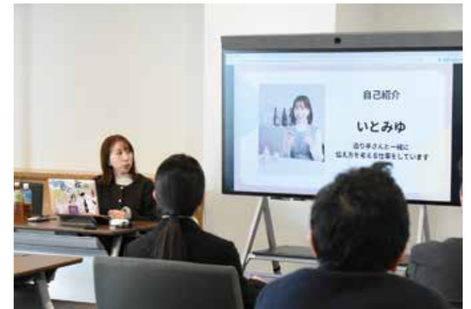
伝わる・選ばれるツールへ SNSセミナー 2/5 テラス沼田

勤労意欲の高揚や職場定着などを目的に実施。各事業所に長年勤務した人や多大な功績を残された21人に表彰状と記念品が授与されました。