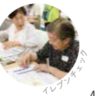
イレブンチェンジ