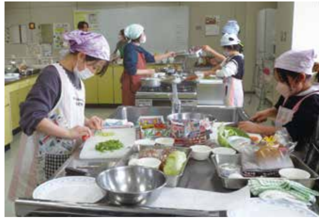
環境に優しい料理を学ぶ エコ料理教室 2/7 保健福祉センター

子育て世代の雇用に積極的な利根沼田地域の企業12社が参加。仕事と家庭の両立を考えている人が参加し、働き方などについて直接相談しました。