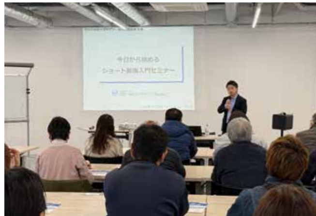
集客の新たな一歩 ショート動画入門セミナー 2/14 テラス沼田

高校生96人が参加。地元企業19社の説明に耳を傾けました。事業内容や福利厚生のほか、地元で働く長所など熱心な説明がされました。