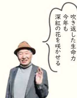
吹き返した生命力 今年も 深紅の花を咲かせる

華道や茶道など日本の古典文化に深く根付いた椿。文字通り、春を告げる花として人々に親しまれ、大木に咲く愛らしい花を目にすることが多い。花がポトリと落ちることから、武士にとっては忌避とされるが、邪気をはらい、長寿や生命力を与える吉祥木と知られる。また、山野に自生するが、古来より作庭家に好まれ造園に植樹される。