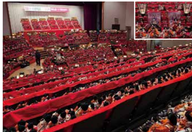
圧巻！7千体超えのひな人形が集結 2/14~3/22 利根観光会館

グローバルマーケティング(株)の藤井俊介さんを講師に招き開催。ショート動画の効果や仕組み、編集の負担を減らす術を学びました。