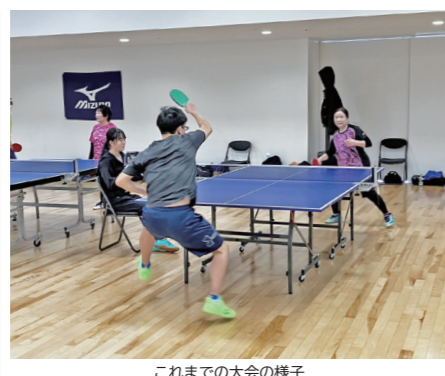
これまでの大会の様子

令和8年度ボランティア活動保険加入受け付けを開始 国内におけるボランティア活動中に起こるさまざまな事故に対する補償制度です。 対象 市内を拠点に無償のボランティア活動をする個人または団体(団体の場合は、加入者名簿を提出) 保険料 ▽基本プラン350円▽天災・地震補償プラン500円 保険期間 4月1日(水)～来年3月31日(水) ※中途加入の場合は、申し込み受け付け翌日からの補償 申込方法 加入申込書に掛付け金を添えて、社会福祉協議会または同協議会白沢・利根支所へ 問合せ 社会福祉協議会 ☎(25) 3267