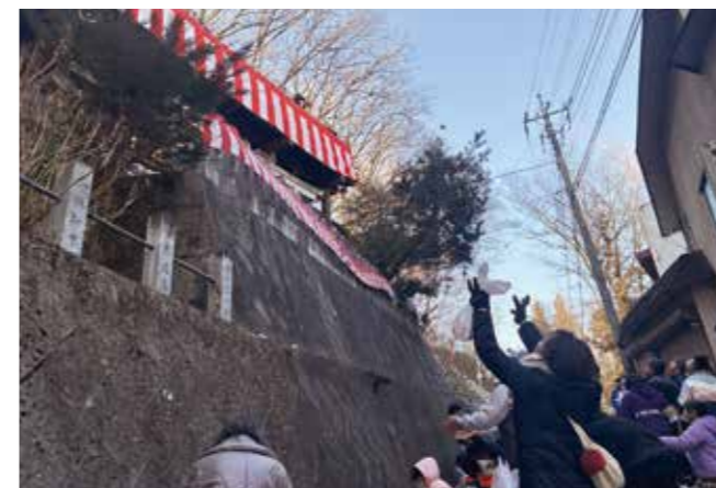
1年間の無病息災を願いみんなで鬼退治 2/3 老神温泉

無病息災を願い、年男や氏子たちが福豆をまきました。赤城神社の境内から豆や菓子が投げられ、それを受け取ろうと、地元の子もたちを中心に多くの人が集まりにぎわいました。夜には、冷たい空気が感じられる中、きらびやかな花火が次々と打ち上げられ、節分祭を大輪の花で締めくくりました。