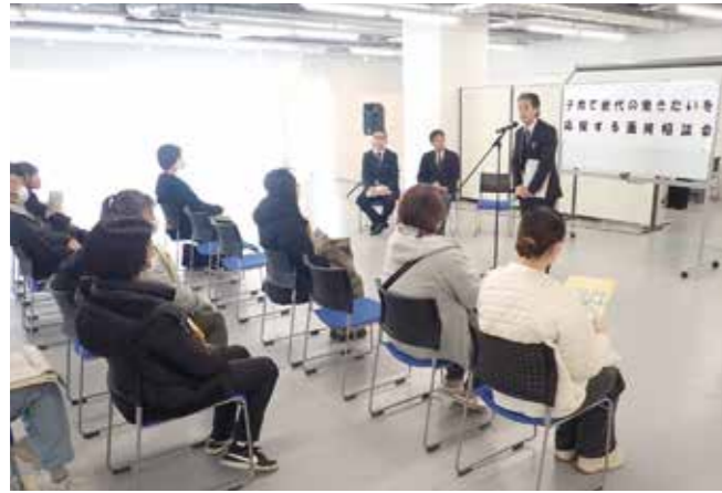
子育て世代の働きたいを応援する面接相談会 2/6 テラス沼田

子育て世代の雇用に積極的な利根沼田地域の企業12社が参加。仕事と家庭の両立を考えている人が参加し、働き方などについて直接相談しました。