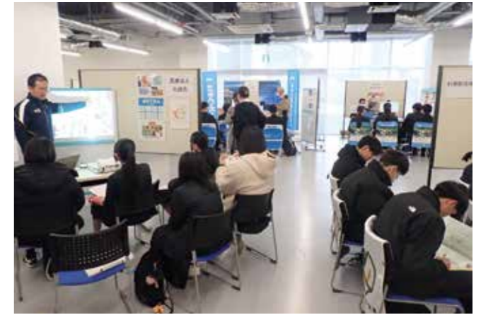
地元企業の魅力を高校生に 企業ガイダンス 1/24 テラス沼田

受講生18人が卒業。中小企業診断士や市内経済界を代表するアドバイザー協力の下、半年以上かけて学習し作成したビジネスプランを発表しました。