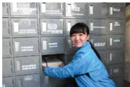
立志の誓いを納碑