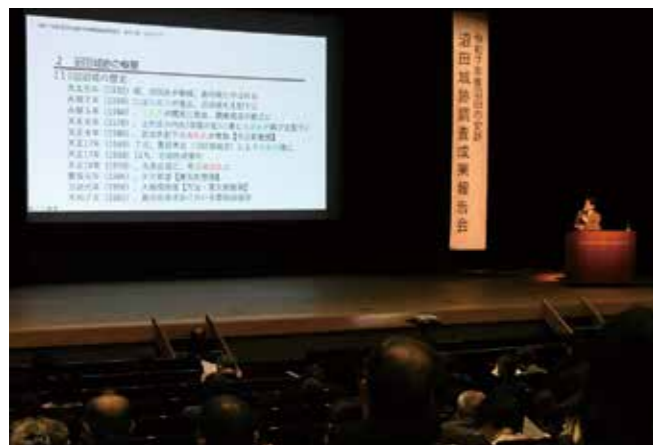
沼田市史跡沼田城跡調査成果報告会 2/15 利根沼田文化会館

SNS・動画クリエイターの伊東美結さんを講師に招き開催。自身のSNSアカウントの段階に合わせた運用方法やアプローチの仕方などを学びました。