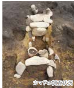
カマドの調査状況