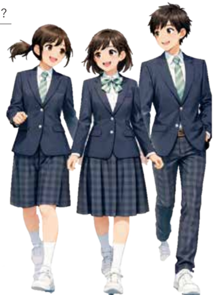
〔デザインイメージ〕