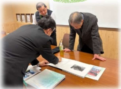
沼田中学校での様子