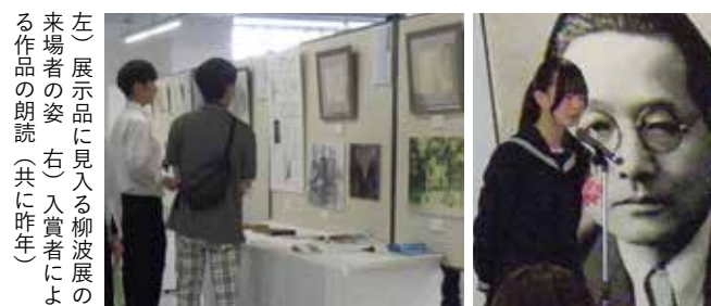
左) 展示品に見入る柳波展の来場者の姿 右) 入賞者による作品の朗読(共に昨年)

名誉市民で、童謡『おうま』『うみ』など数多くの作詞を手掛けた童謡作家・林柳波。その功績や人となりに触れてもらうため、所蔵資料や関連資料などを展示する「柳波展」を開催します。