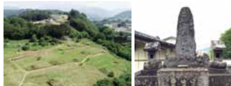
上) 迦葉山龍華院弥勒禅寺略縁記 下左) 奈良古墳群(県指定史跡) 下右) 海野塚(市指定史跡)

市内各地区の魅力に迫る企画展の第三弾として、池田の歴史や文化財を紹介しつゝ、池田地区は、1889(明治22)年から1954(昭和29)年まで存続した旧池田村に当たります。市の西北部に位置し、南北に細長い地形で、地区の北部には信仰の山である迦葉山がそびえています。また、市内で唯一の県指定史跡の奈良古墳群があることでも知られています。