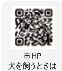
市HP 犬を飼うときは

その他 マイクロチップを装着している場合、環境省「犬と猫のマイクロチップ情報登録」に、来場の2日前までに登録してください