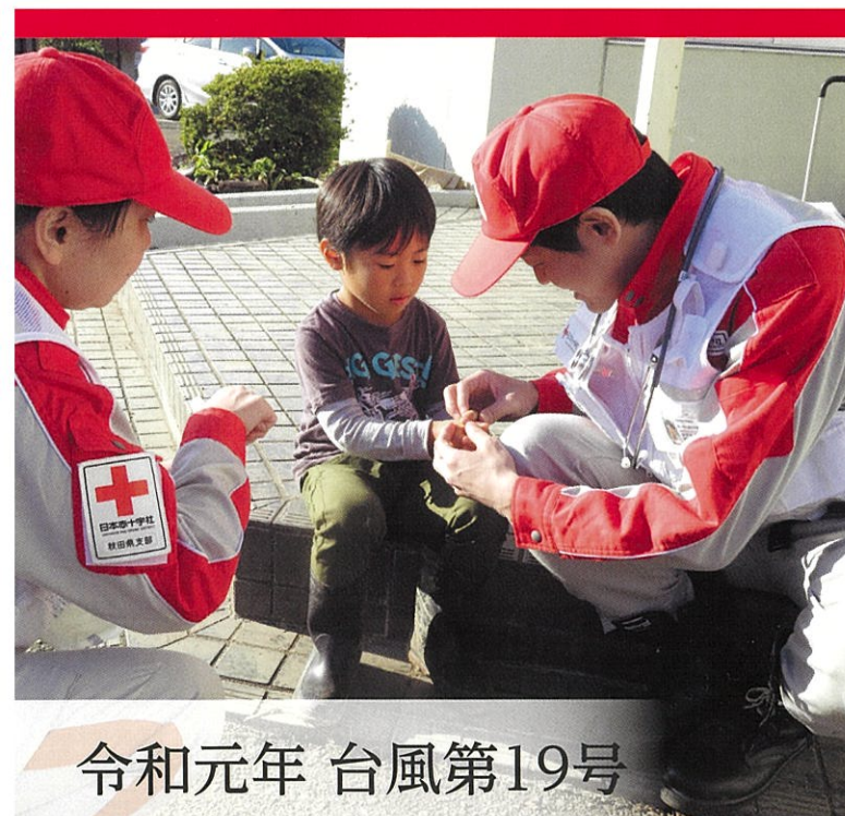
令和元年 台風第19号