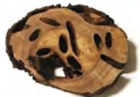
食い荒らされた木

幼虫は、サクラやウメ、モモなどの生きている木に寄生し、木の中を食い荒らす外来の昆虫です。繁殖力が非常に高く、生態系や農業などに甚大な被害を及ぼすことから、環境省が特定外来生物に指定し、飼育や販売、生きたままの運搬などが禁止されています。本市では令和 6 年 7 月に初めて沼田公園で確認され、その後、各地でフラスが確認されています。