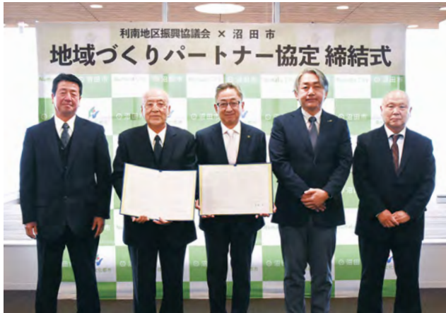
市役所で行った締結式

地域の特性や課題に応じた取り組みを進めるために、連携しながら、持続可能な地域づくりを進めていきます。