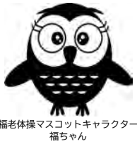
福老体操マスコットキャラクター 福ちゃん