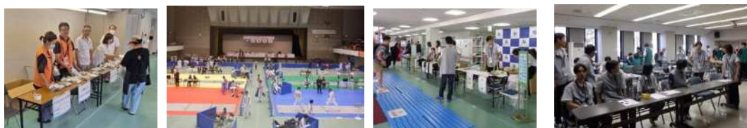
(おもてなし) (会場設営・競技運営) (各種受付) (補助員、用具検査)